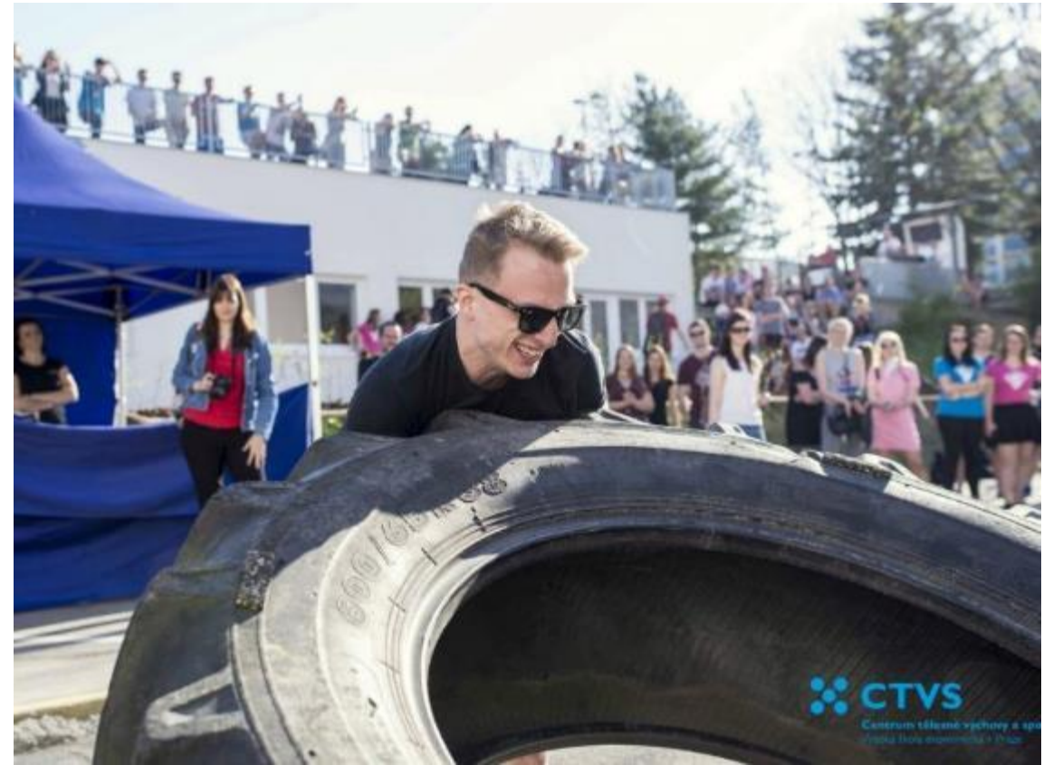
Rektorský sportovní den