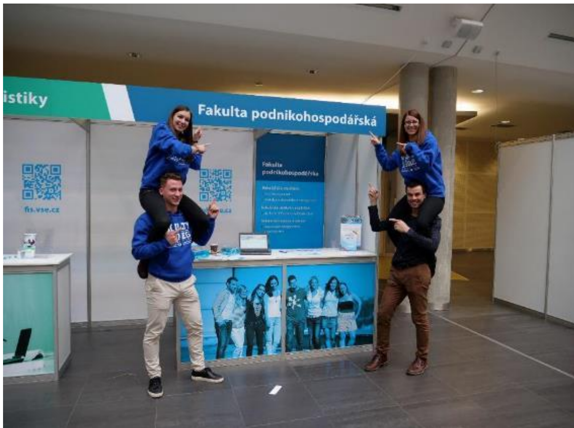
Den otevřených dveří