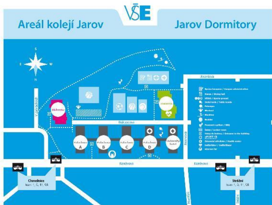
Areál kolejí Jarov